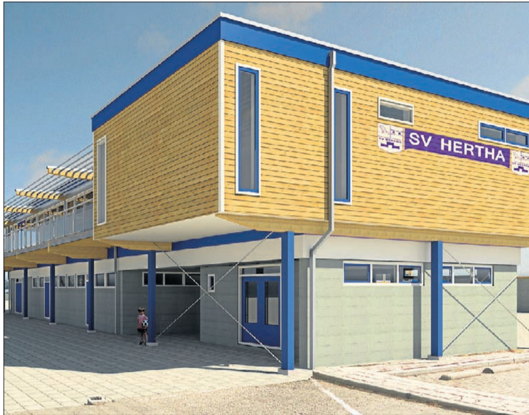
Voorbeeld van de nieuwe kantine op de bestaande kleedaccommodatie langs het hoofdveld (Ref: Casper van Gorselen & Martijn Zeldenrijk)