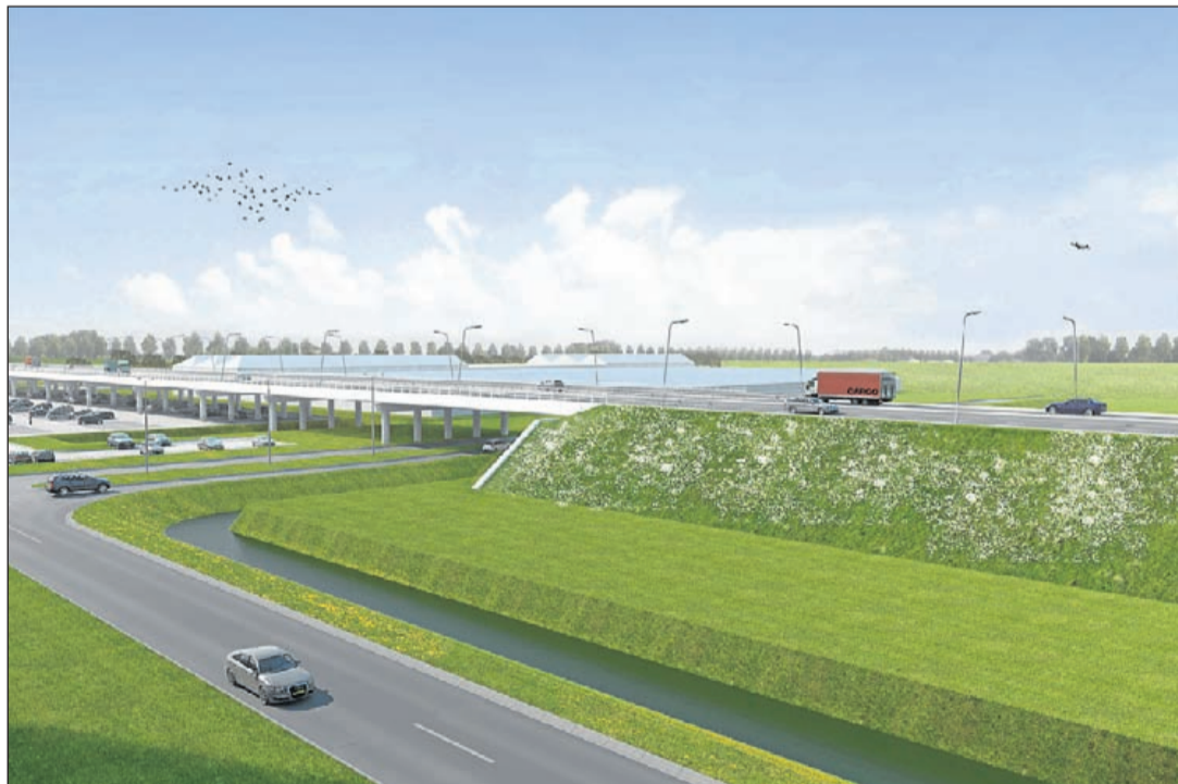
Het een na laatste deel van de N201 bij Schiphol-Rijk met o.a. de fly-over wordt op 15 december opengesteld voor het verkeer. Rest alleen het aquaduct bij Amstelhoek nog (Illustratie: Projectbureau N201+).